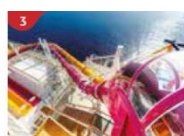
Waterslide Park Get drenched in fun on one of our six different waterslides.