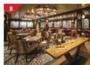
Bistro By Mark Best Relish contemporary Western cuisine from the internationally-acclaimed Australian chef.