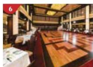
Dream Dining Room Savour a wide variety of Asian and international cuisine.