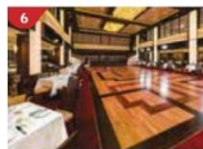
Dream Dining Room Savour a wide variety of Asian and international cuisine.