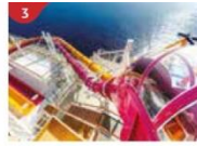
Waterslide Park Get drenched in fun on one of our six different waterslides.