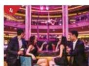
Bar 360 Catch live music and aerial acrobatic performances with a glass of champagne.