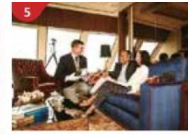
The Palace Indulge in European-style butler service and exclusive facilities.