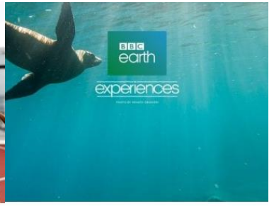
BBC EARTH EXPERIENCES

Kids ages 3 to 17 can enjoy an array of exciting activities. Registration required for children under 13.