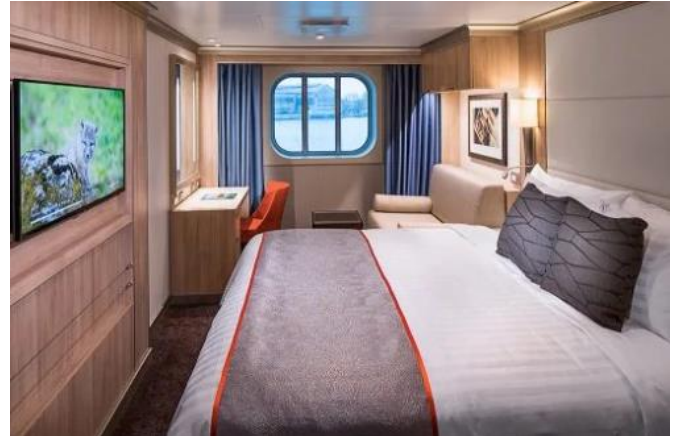
ห้องพักแบบมีหน้าต่าง (Exterior) 25 ตร.ม.