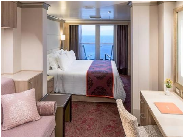
Vista Suite 33 ตร.ม.