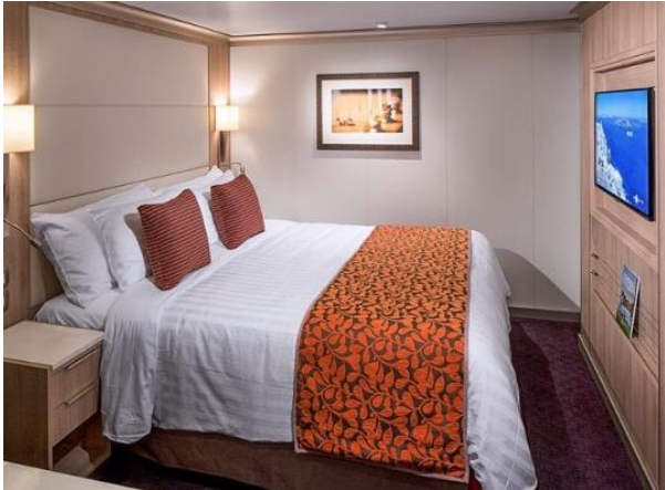
ห้องพักแบบไม่มีหน้าต่าง (Interior) 20 ตร.ม.