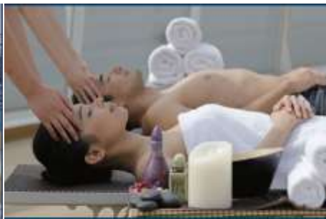
Spa and Health Club