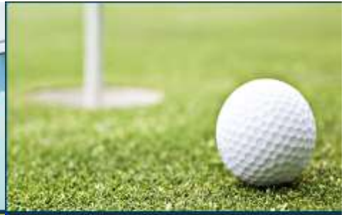
Golf Driving Range