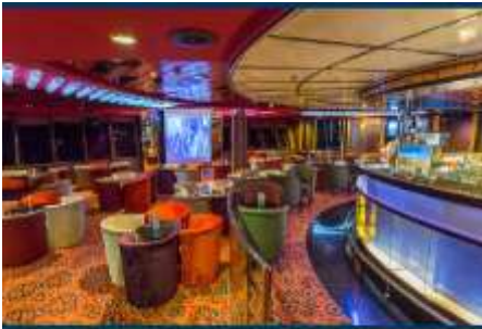
Karaoke Lounge / KTV