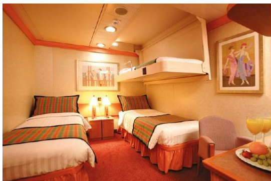
ห้องพักแบบไม่มีหน้าต่าง