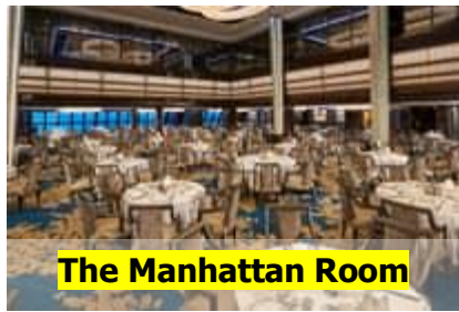
The Manhattan Room