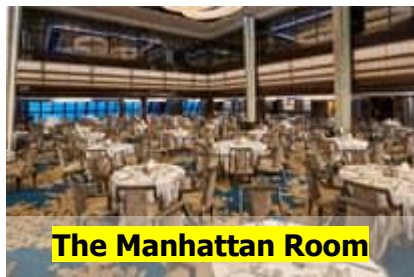
The Manhattan Room