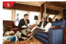
The Palace Indulge in European-style butler service and exclusive facilities.