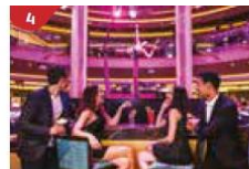
Bar 360 Catch live music and aerial acrobatic performances with a glass of champagne.