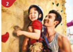
Rock Climbing Wall Challenge yourself on our mountainous rock climbing wall.