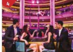
Bar 360 Catch live music and aerial acrobatic performances with a glass of champagne.