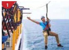
1 Ropes Course & Zipline Feel the thrill of gliding above the ocean on a 35-metre zipline.