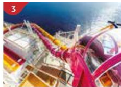
3 Waterslide Park Get drenched in fun on one of our six different waterslides.