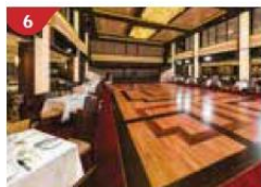
6 Dream Dining Room Savour a wide variety of Asian and international cuisine.