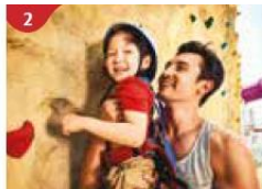
2 Rock Climbing Wall Challenge yourself on our mountainous rock climbing wall.