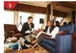
5 The Palace Indulge in European-style butler service and exclusive facilities.