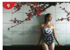
9 Crystal Life™ Spa Rejuvenate mind, body and soul with our holistic Western and Asian spa experience.