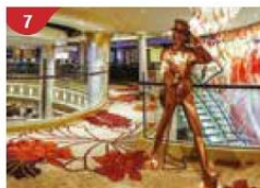
7 Johnnie Walker House™ Immerse yourself in the intricate world of premium Scotch whisky.