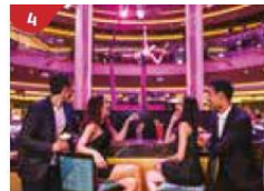
4 Bar 360 Catch live music and aerial acrobatic performances with a glass of champagne.