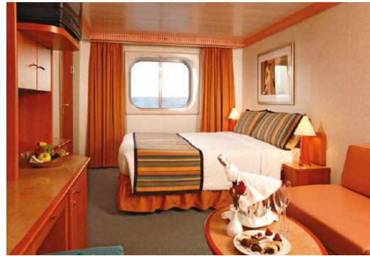
ห้องพักแบบมีหน้าต่าง