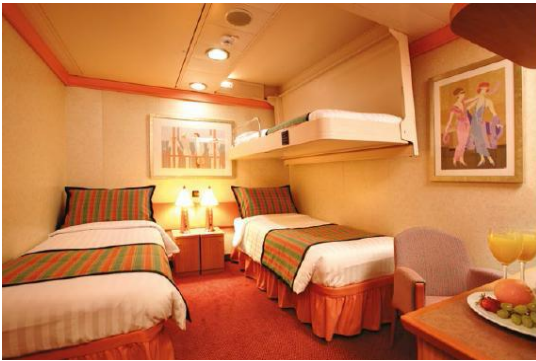
ห้องพักแบบไม่มีหน้าต่าง