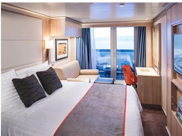
ห้องพักแบบมีระเบียง Balcony 28 ตร.ม.