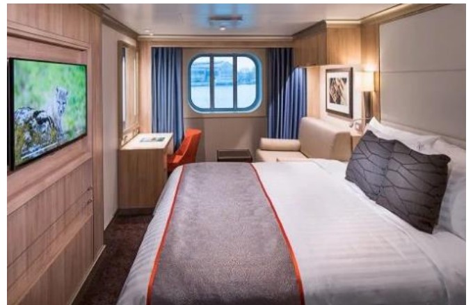
ห้องพักแบบมีหน้าต่าง (Exterior) 25 ตร.ม.