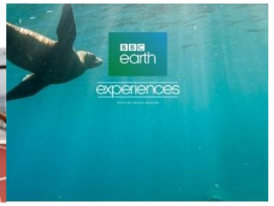
BBC EARTH EXPERIENCES

Kids ages 3 to 17 can enjoy an array of exciting activities. Registration required for children under 13.