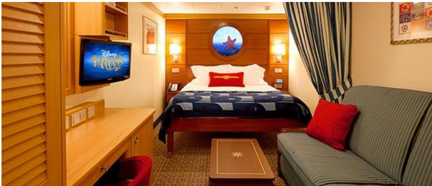
ห้องพักประเภทไม่มีหน้าต่าง ขนาดห้อง 17.09 ตรม. - 19.88 ตรม.