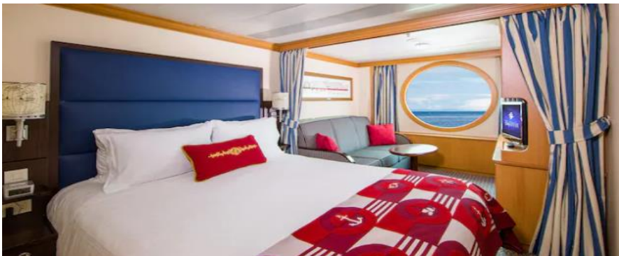
ห้องพักประเภทมีหน้าต่าง ขนาดห้อง 19.88 ตรม.