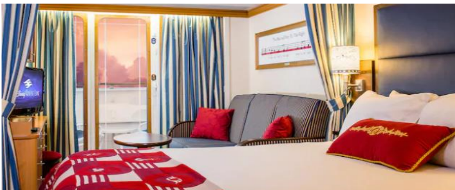
ห้องพักประเภทมีระเบียง ขนาดห้อง 24.89 ตรม. - 28.24 ตรม.