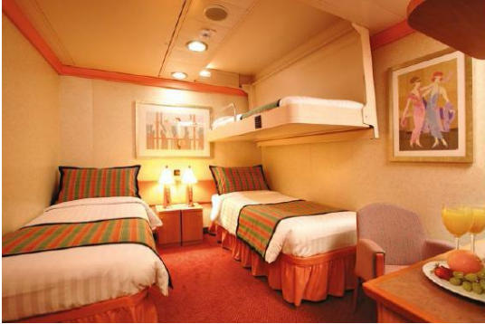
ห้องพักแบบไม่มีหน้าต่าง