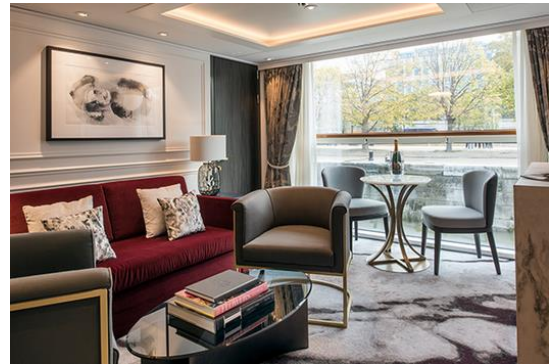
CP: CRYSTAL PENTHOUSE (47 SQ.M) DECK 3