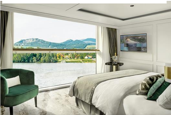
S1 , S2: Deluxe Suite with Panoramic Balcony-Window (23.5 SQ.M) S1 Deck 3 , S2 Deck 2