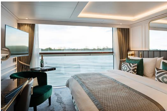
S4 , S5 : Petite Suite with Panoramic Balcony-Window (17.5 SQ.M) S4 Deck 3 , S5 Deck 2