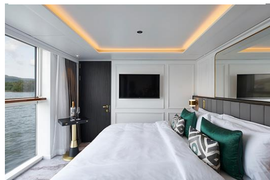
S3 : Deluxe Suite with Panoramic Balcony-Window (22 SQ.M) S3 Deck 2